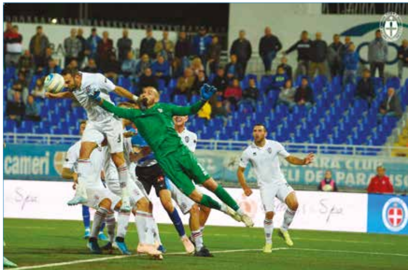
Quel derby perso ad ottobre grida ancora vendetta...

caduta libera dopo una prima fase del campionato in cui sembrava addirittura una degna contendente del primo posto in classifica. Per ragioni di stampa ovviamente scrivo prima del recupero infrasettimanale. Ottavo posto in classifica con soli 29 punti. Anche peggio ha fatto la Pro Vercelli che di punti ne ha solo 24 e occupa la quattordicesima posizione, non lontano dalla zona play out. Da qui nasce la riflessione: e noi dovevamo proprio perderci i derby contro tutti e due? Beh, sarà per il girone di ritorno, dovremo rifarci con gli interessi. Magari spendendo le bianche casacche proprio ai play out!