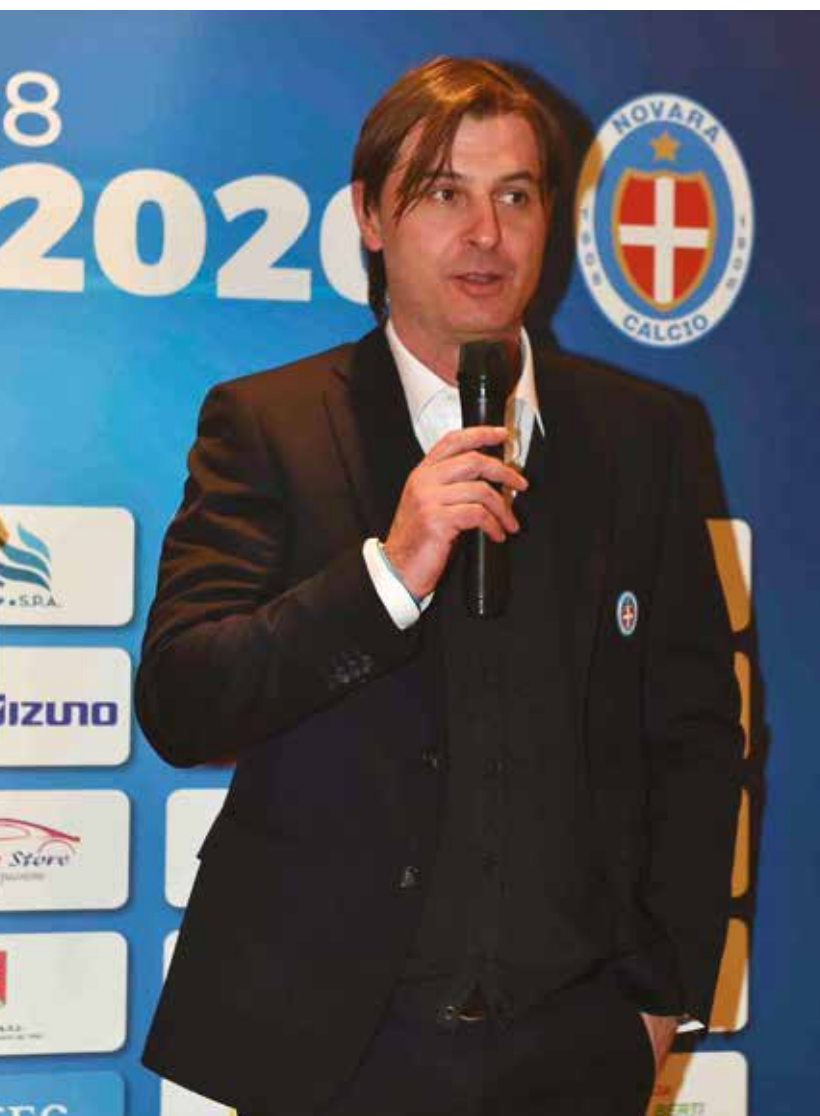
Il Presidente alla serata di presentazione a Novarello

“La figura del presidente sportivo è molto diversificata, questo sì,