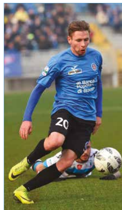
Senza Kupisz il Bari vola

Seconda riflessione che arriva di conseguenza: l'Alessandria è in