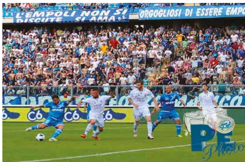
Da "Pianeta Empoli" uno dei tanti match giocati al "Castellani"