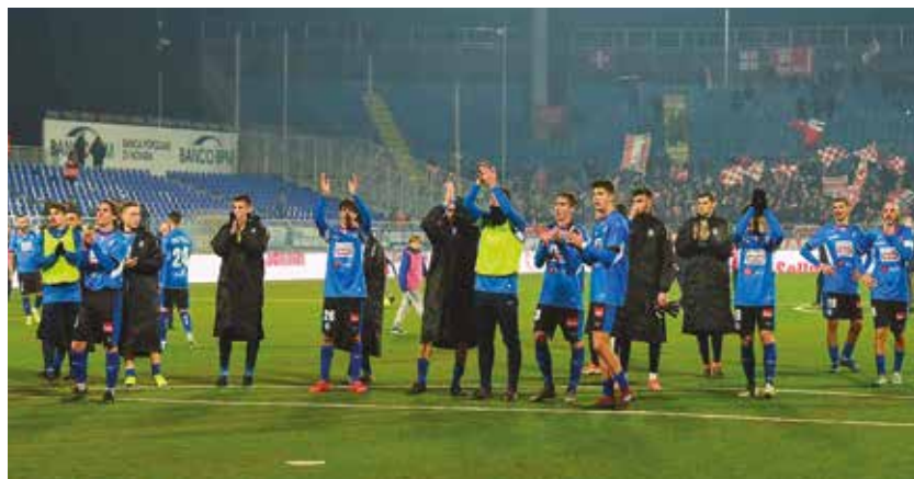
I giocatori salutano la Curva Nord al termine dell'incontro

risultato, nessuno sia tornato a casa realmente deluso dalla prestazione di Buzzegoli e compagni che per un'ora hanno impegnato seriamente la capolista sfiorando a più riprese il vantaggio. Ora si torna alla normalità. Non ci sono vip in tribuna, né biglietti a prezzi scontati. Ma in campo c'è