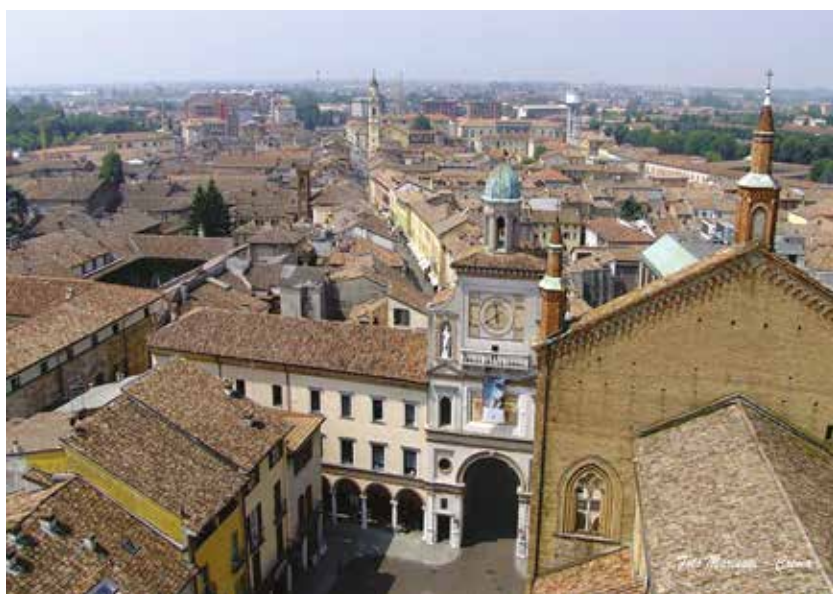
Per chi volesse farci un giro... uno scorcio di Crema

Un altro ritorno al passato: domenica rieccoci al "Voltini" di Crema