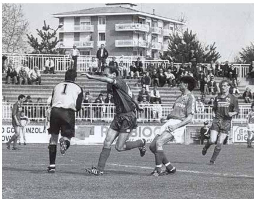
Una fase di Novara-Montevarchi della primavera 1991