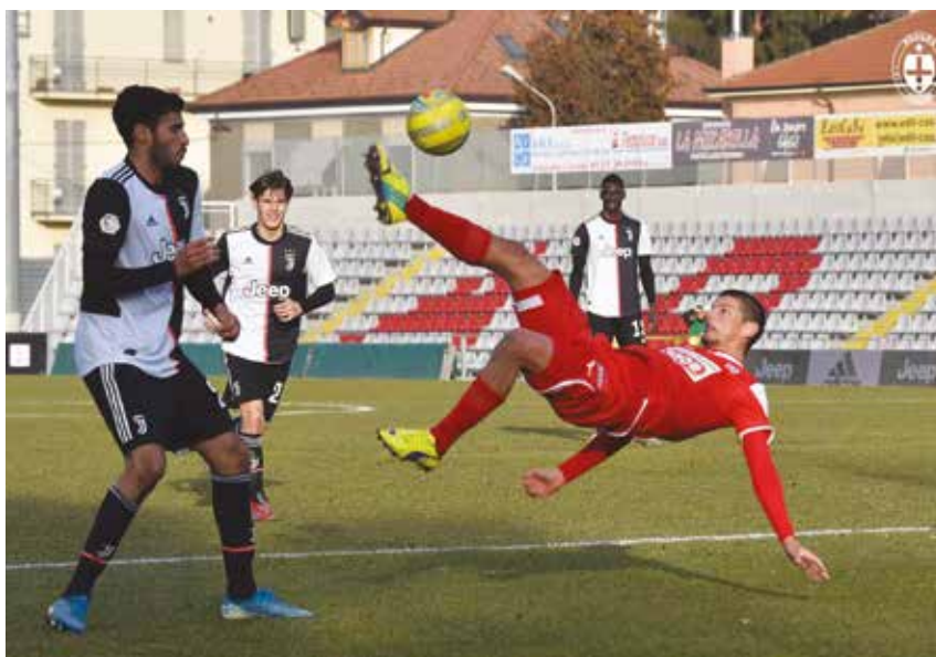
Uno dei tanti tentativi portati nell'area di rigore bianconera