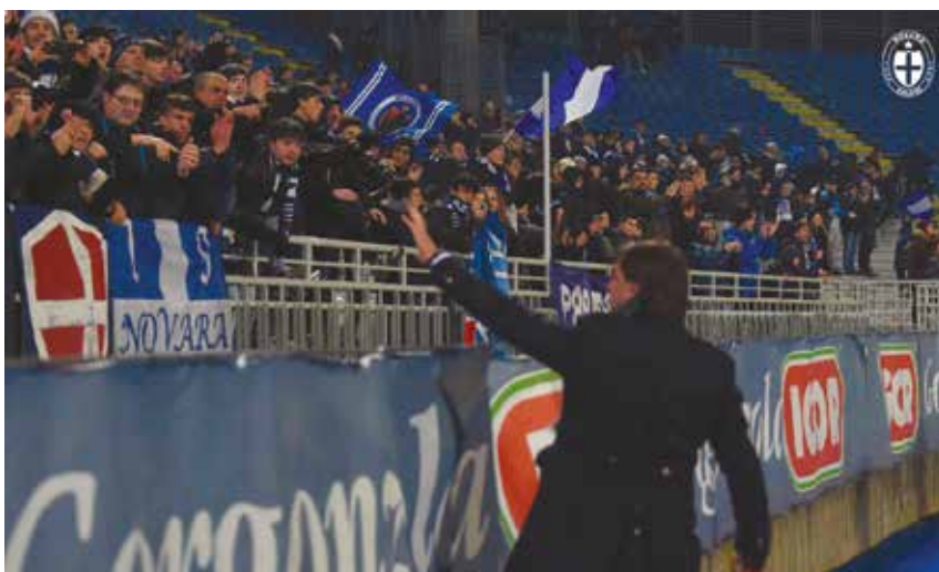
Con il Monza sotto la Curva Nord