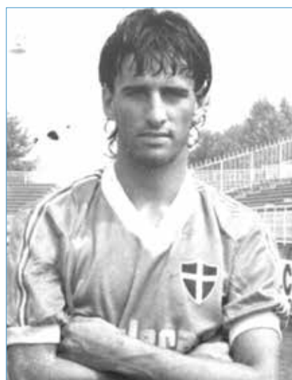
Birtig protagonista in Toscana

ci aveva affossati a giugno nella partita senza appello), Mariotti, Tagliaferri (46' Perfetti), Parlanti. Decise la contesa un molisano 22enne appena arrivato e che presto sarebbe diventato il beniamino della tifoseria azzurra: Ugo (detto poi Ugol) Armanetti, da Campobasso. Manco a dirlo