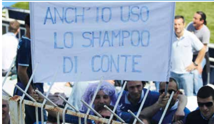
L'ennesimo tormentone a spese di Antonio Conte