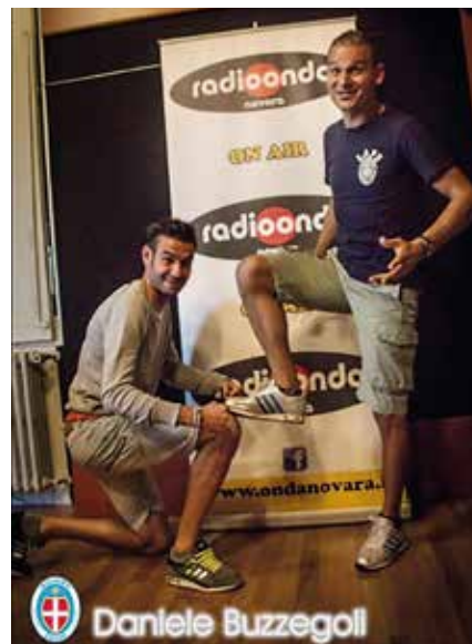
Un momento da immortalare

"Non credo tu lo abbia letto su Novella 2000, comunque è tutto vero. Sono nato a Firenze e lì sono cresciuto, la