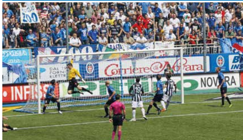
Maggio 2011: il Siena deve rimandare la festa