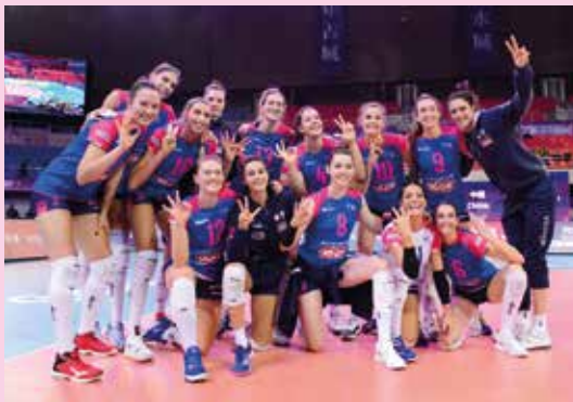
Il quarto posto finale non rende giustizia

Recuperata giovedì sera la partita rinviata per poter partecipare al Mondiale contro le torinesi di Chieri, oggi, subito a ridosso della