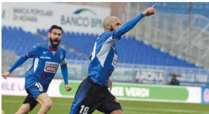
I due "veterani" esultano per l'1-0 alla Pianese

Partita Pro Patria-Novara (giornalisti votanti Faranna, Foti, Massara, Molina): 1 Buzzegoli, 2 Nardi, 3 Bortolussi.