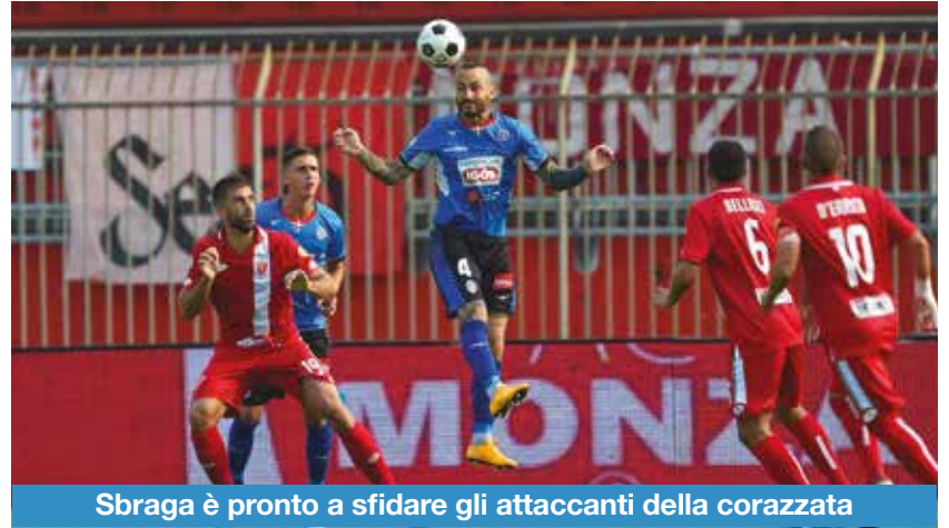
Sbraga è pronto a sfidare gli attaccanti della corazzata

si giocheranno infatti in contemporanea: la 37esima sabato 18 aprile alle 15, la 38esima domenica 26 aprile alle 17.30.