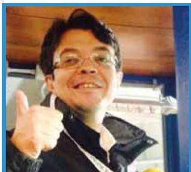
di Massimo Barbero

È dolce arrampicarsi in cerca di un posto in classifica sempre più prestigioso, senza sapere bene fin dove si potrà arrivare. È bello arrampicarsi con l'incoscienza di chi pensa di non aver nulla da perdere. O almeno in campo dà questa sensazione.