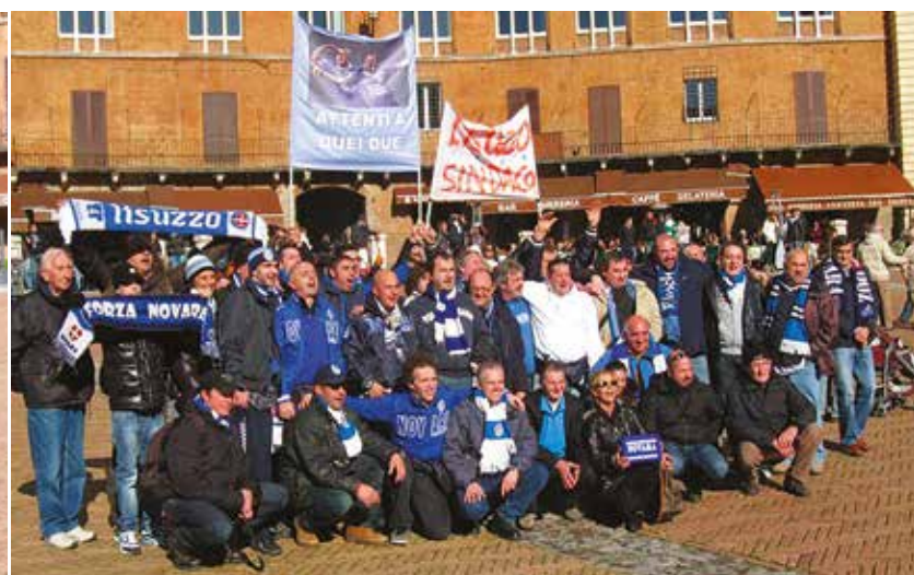
Sabato 27 novembre 2010: Piazza del Campo invasa da tifosi azzurri di tutte le età