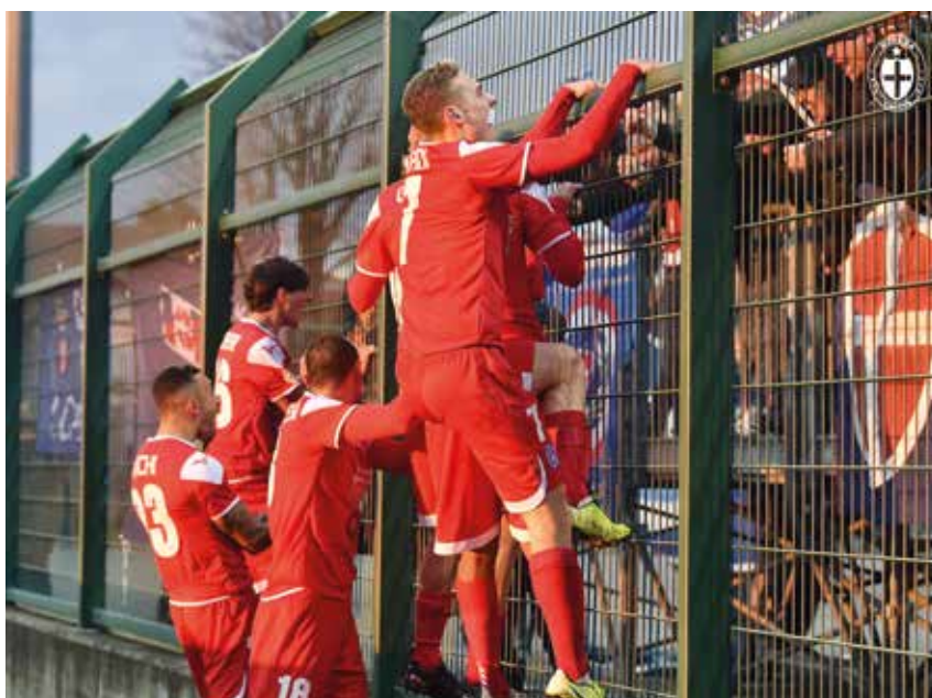
Gli azzurri festeggiano con i tifosi al seguito la rete del 2-1 allo "Speroni"

Il dolce gusto di scalare la classifica, senza troppi pensieri