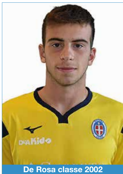
De Rosa classe 2002

"All'età di 8 anni nella squadra dell'oratorio del mio paese. Molti miei amici giocavano già a calcio