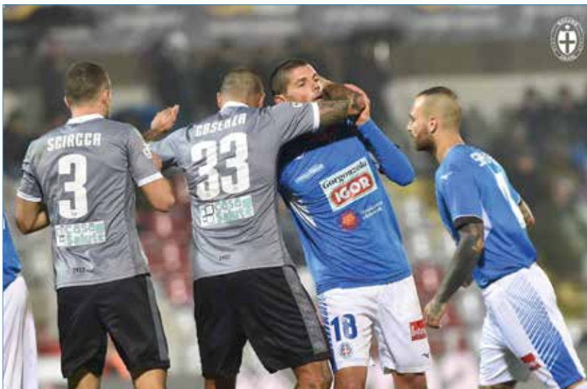
Momento difficile per la squadra dell'affettuoso Cosenza

Diciamo che ad Alessandria il periodo invernale non va proprio per la maggiore (strano però, perché è prevalentemente grigio come la loro maglia). Dopo la vittoria, ahinoi, contro gli azzurri del due novembre i mandrogni (da Mandrogne, nota frazione del capoluogo piemontese) hanno inanellato tre sconfitte e due pareggi, con in mezzo anche l'eliminazione in Coppa Italia per mano della Juventus Under 23. Stessa sorte della scorsa stagione in cui a gennaio la squadra di D'Agostino collezionò in sette gare la miseria di quattro punti. Ruolino di marcia che costò il posto al tecnico siciliano. A questo punto, se fossimo in Scazzola, cominceremo a guardarsi bene le spalle e controllare se la panchina sia ancora al suo posto!