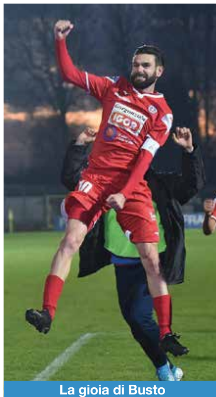
La gioia di Busto

Buba, ricordi le famose scarpe che mi lucidasti il 17 settembre del 2013 in occasione di una trasmissione radiofonica? Ebbene le conservo ancora e le uso di nasco-