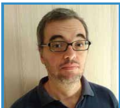
di Enea Marchesini