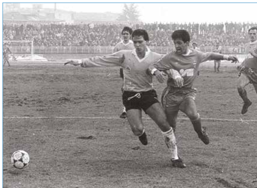
Febbraio 1987: il sopraffino Dolcetti in azione

La vittoria di Lucca ci ha dato respiro. Ed abbiamo bisogno proprio di 3 punti per blindare i play off.