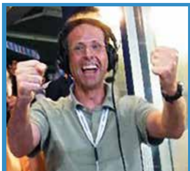
di Paolo Molina