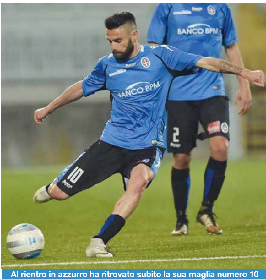
Al rientro in azzurro ha ritrovato subito la sua maglia numero 10