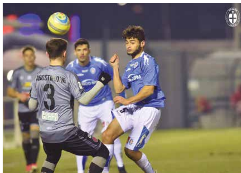
Una fase del derby d'andata terminato 1-1