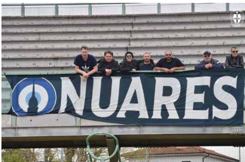
Alcuni super tifosi azzurri presenti anche al "Porta Elisa"

Finalmente a Lucca è arrivata la vittoria tanto attesa