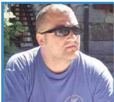
di Thomas Gianotti

Ultimo derby nella stagione regolare per gli azzurri che affrontano i quattro ostacoli che ancora li dividono dagli spareggi promozione che, pur non essendo certo acquisiti e matematici, appaiono cosa probabile. Magra consolazione per una stagione che non ha certo entusiasmato. I ragazzi di Sannino arrivano alla sfida contro i grigi dopo la vittoria di Lucca che ha mostrato un Novara solido e determinato, pur con le solite lacune e amnesie.