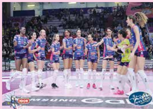
Le azzurre a caccia del triplete

Play off in salita invece per il club del patron Fabio Leonardi sconfitto nettamente domenica scorsa per 3 a 0 in gara 1 dei quarti di finale scudetto sul campo del PalaEstra di Siena da il Bisonte Firenze, sfrattato per l'occasione dal suo campo abituale del Mandela Forum del capoluogo toscano.