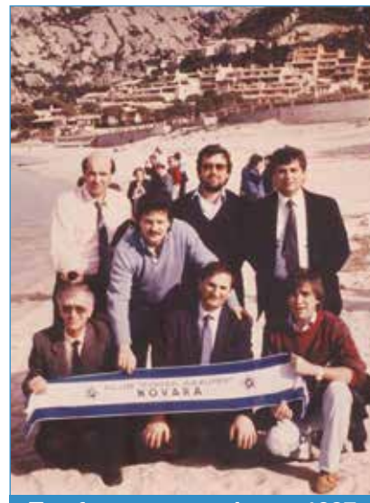
Trasferta azzurra datata 1987

Aggiungeva, tuttavia: Questa bella pianura di Terranova, un tempo tanto fiorente da contare dodici città e settanta comuni, così felicemente situata in riva al mare, riparata dalle montagne e con un così buon clima, potrebbe nutrire più di 50.000 abitanti; infatti possiede ancora tutti