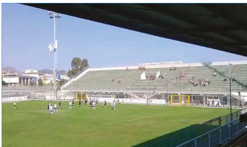
Dopo 23 anni il Novara torna a giocare al "Nespoli"

Gli edifici più importanti erano la cattedrale extra-muros di San Simplicio, il palazzo giudicale (oggi non più esistente) e la chiesa di San Paolo.