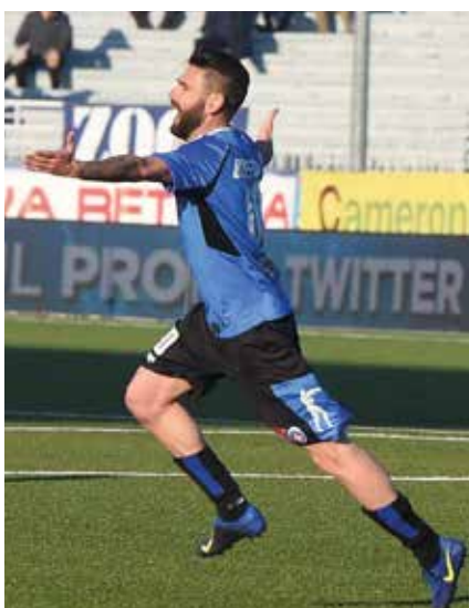
La gioia dopo il gol all'Arzachena

difficoltà. Lo ribadisco, è importante portare a conoscenza di tutti l'autismo al fine di preparare serenamente anche le famiglie "normali" qualora si interfacciassero con soggetti autistici. È giusto che i genitori si incontrino tra loro e si ascoltino a vicenda per compiere un percorso di crescita reciproca. Oltre all'Angsa io ed altre persone abbiamo fondato a Firenze la onlus "Un calcio per tutti", un'associazione di cui sono il Presidente che lavora con ragazzi che hanno disabilità medio-gravi intellettive e motorie. Grazie ad un team molto preparato seguiamo 27 ragazzi dai cinque ai vent'anni a cui diamo la possibilità di fare sport. Ovvero recuperiamo i ragazzi a casa con i pulmini e li portiamo al campo, li vestiamo, gli facciamo fare allenamento, li aiutiamo a lavarsi e li riportiamo a casa. Ciò è linfa vitale per i ragazzi che non rinunciano ad esercitare uno sport sinonimo di aggregazione e crescita e nello stesso tempo concediamo un po' di riposo alle famiglie che possono