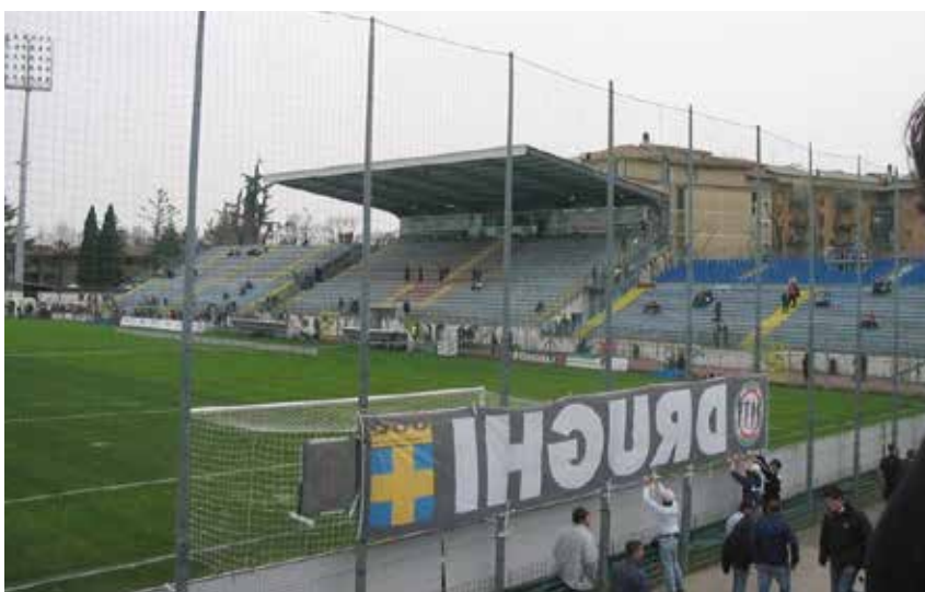
Il "Tenni" di Treviso tornerà ad ospitare partite di serie B?

Il Pordenone diventa Treviso? Un plauso al "Cholo" che omaggia Pisa