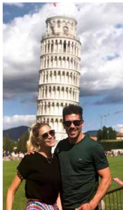
Nostalgia della torre pendente