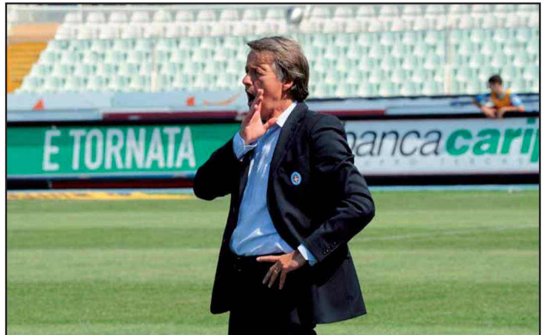
Un Tesser tranquillo