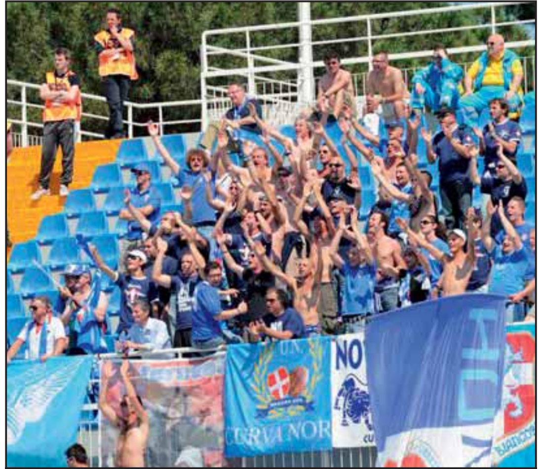
tifosi presenti con Tarta e Clementoni in prima fila