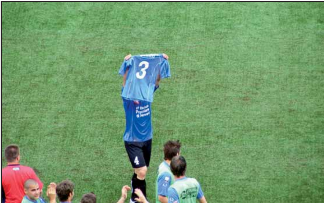
novara frosinone 2-1 Bel gesto di Lisuzzo che dedica il gol a Gemiti