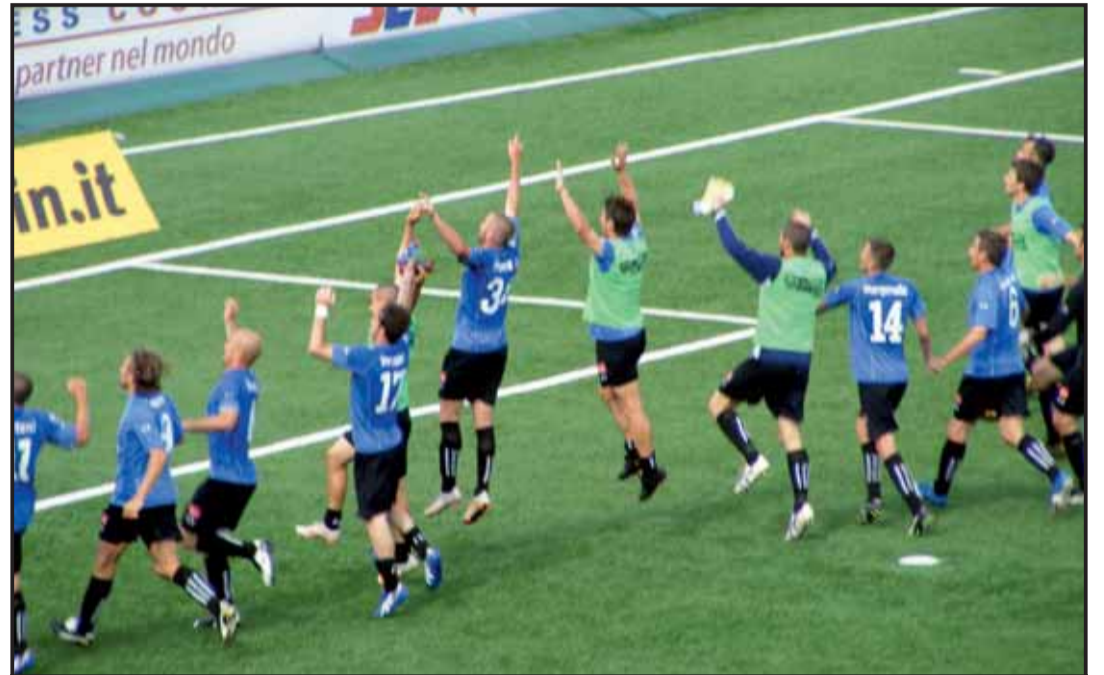
novara frosinone 2-1 GRAZIE