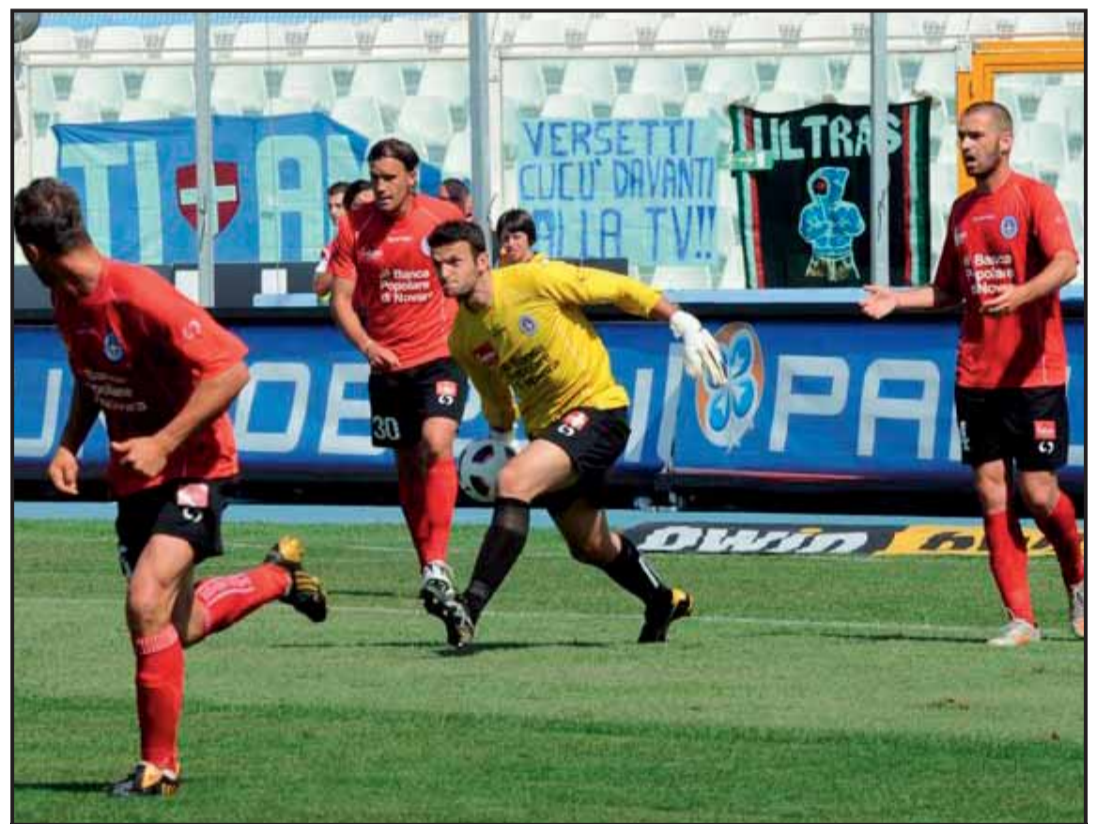
Ujkani rilancia il contropiede