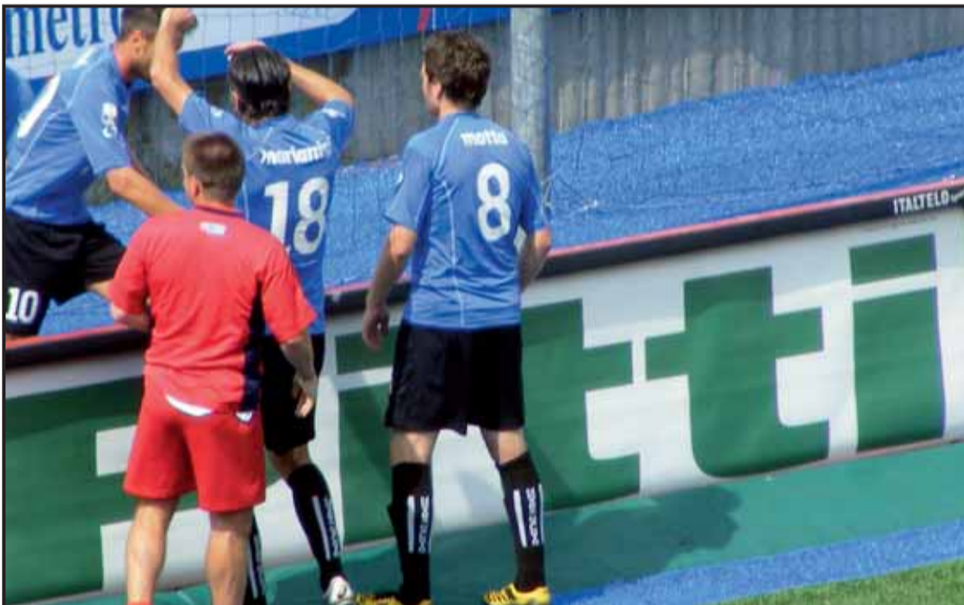
novara frosinone 2-1 Festeggiamenti sotto la curva