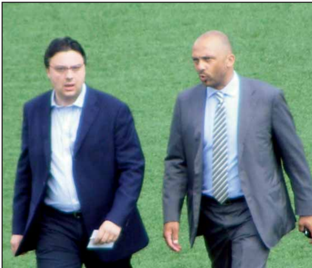
Ultime traversate del Piola