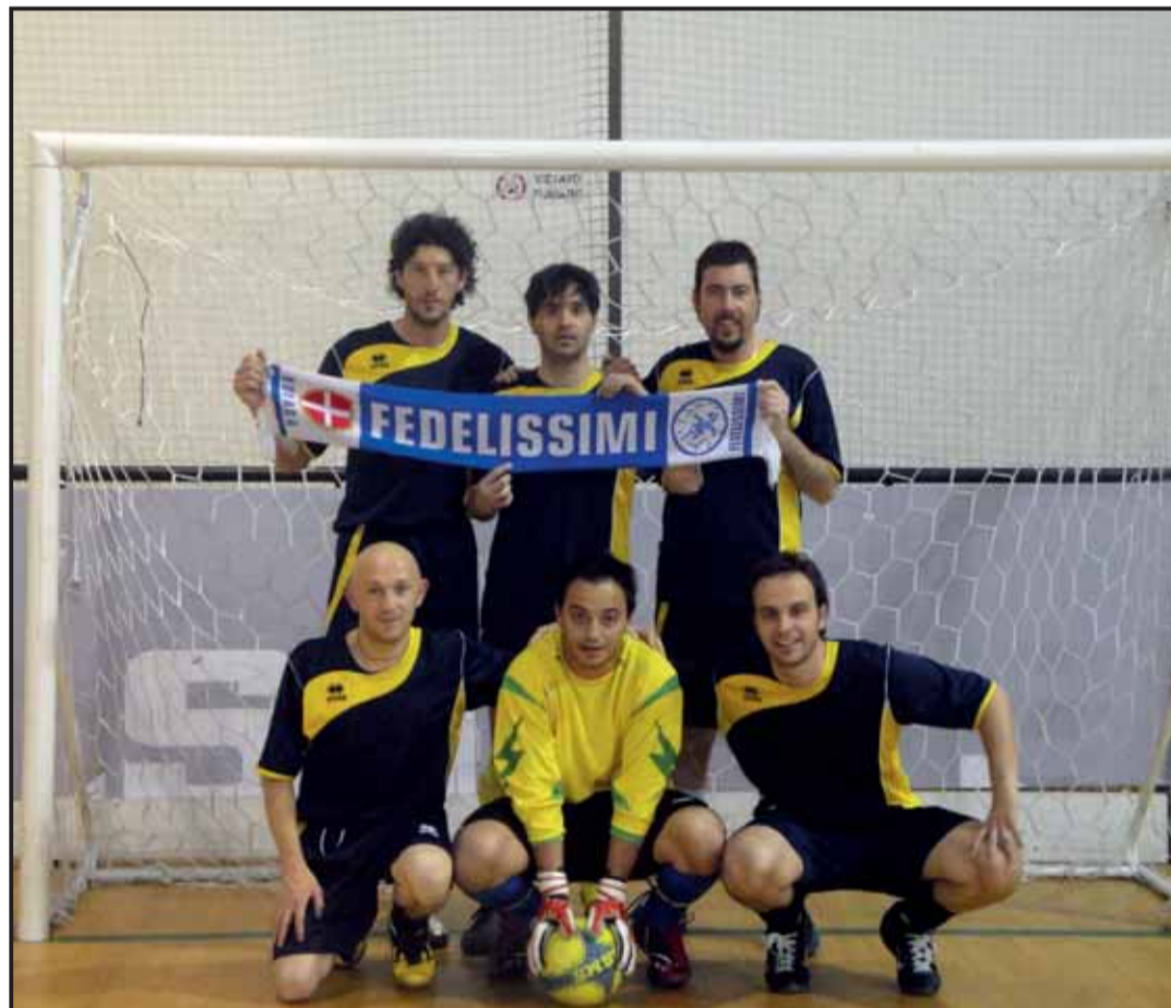
La squadra dei Fedelissimi ha conquistato un brillante secondo posto nel recente torneo di calcetto al Palaverdi