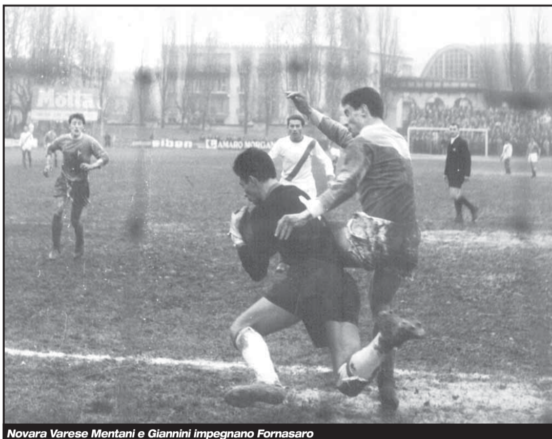
Novara Varese Mentani e Giannini impegnano Fornasaro