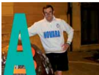
di Beppe Vaccarone

Finalmente col recupero di ieri pomeriggio (Pescara-Empoli 1-0) abbiamo per una volta la classifica completa e reale.