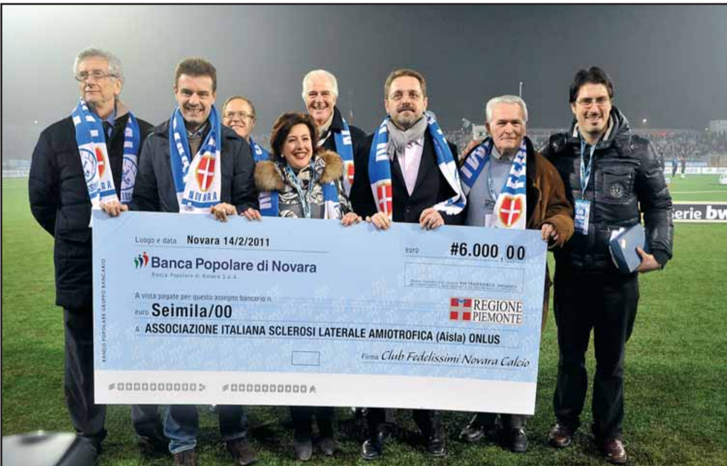
Consegna assegno all'Onlus contro la SLA