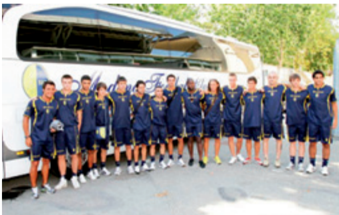
Una bella foto con la rosa dei nostri avversari

Con l'occasione auguro a tutti, giocatori, Società e naturalmente tutti i Fedelissimi e Voi tifosi di ogni ordine di spalti, unitamente alle Vostre famiglie, i più cordiali auguri di azzurrissime Feste Natalizie ed ottimi inizio di anno nuovo.