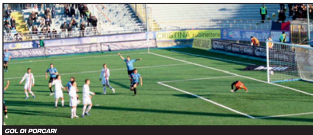
GOL DI PORCARI