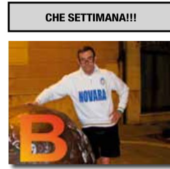
di Beppe Vaccarone

Alzi la mano chi ha immaginato una settimana come quella passata. Vittoria senza discussione col Benevento (La squadra migliore vista al Piola secondo me), Eliminazione del Siena dalla Coppa Italia che conta (e ora il Milan) e cosa più importante a parer mio a Cremona nella tana dei grigiorosi ricacciati a 5 punti di distacco in classifica. Ma la navigazione è ancora piena di insidie. Stasera in posticipo televisivo avremo un avversario storico quale l'Arezzo, che pur distanziato resta un avversario per la lotta ai vertici della classifica. Pur rimanendomi dei