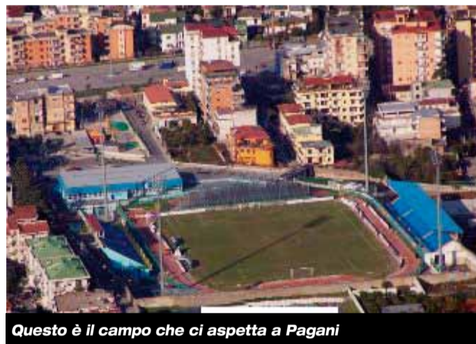
Questo è il campo che ci aspetta a Pagani