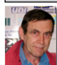
di Beppe Vaccarone

Parliamo chiaro. La matematica non ci condanna, ma la logica e le ultime prestazioni della squadra si. Prestazioni impiegate, da gente che scende in campo per timbrare il cartellino. Un Novara irricognoscibile rispetto a quello che ci aveva fatto sognare. Ora siamo sovrastati da squadre che solo mesi fa ci vedevano da lontano e i valori piano piano si stanno esprimendo. Noi abbiamo avuto la sfortuna di vedere prolungata l'eutanasia di un amore, solo perché per molto tempo quando ci fermavamo, si fermavano gli altri. Se poi guardiamo come si falsa un campionato, beh possiamo dire che