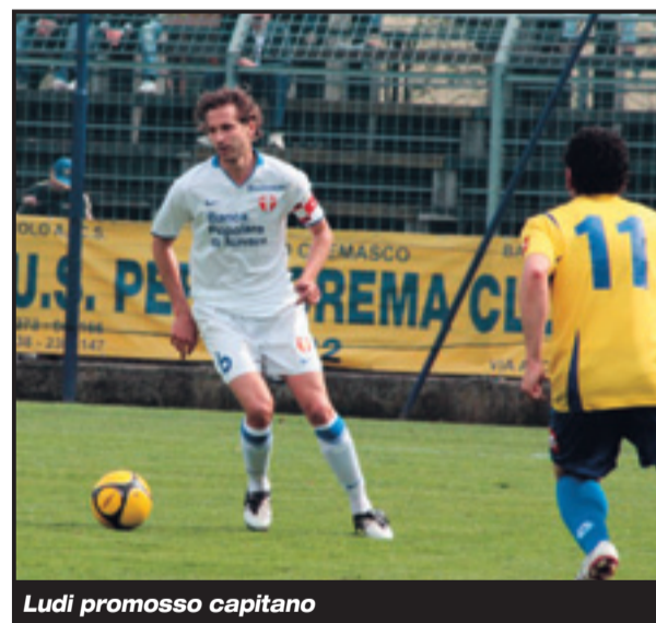
Ludi promosso capitano