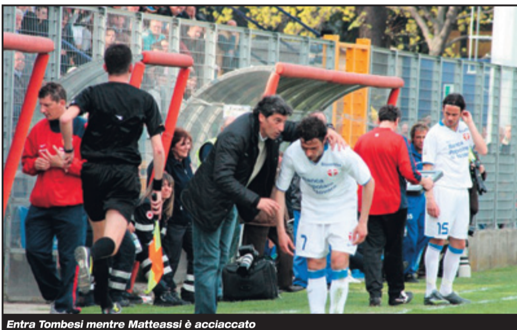
Entra Tombesi mentre Matteassi è acciaccato