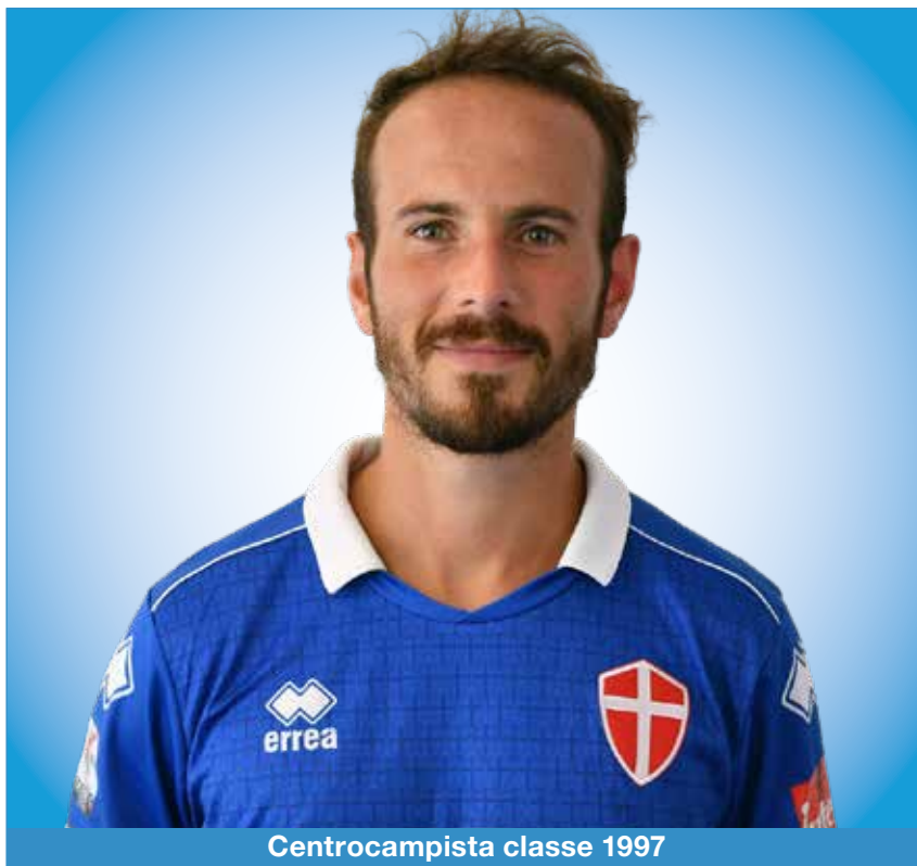
Centrocampista classe 1997

A livello globale, invece, come valuti la nutrita schiera di giocatori che sono migrati dai maggiori campionati europei alla