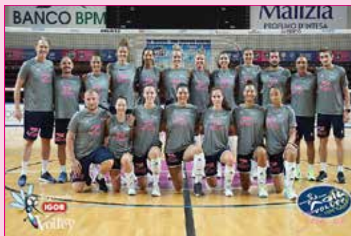
Foto di gruppo durante la preparazione