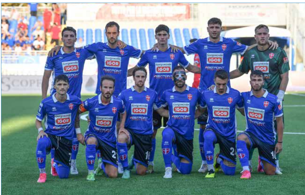
Secondo in basso da sinistra, con la fascia da capitano, prima della gara con la Pro Patria

In realtà mia sorella e i miei genitori mi seguono ad ogni partita, sia in casa che in trasferta. Durante le partite casalinghe si accomoda nel settore dei "distinti", dove vengo-