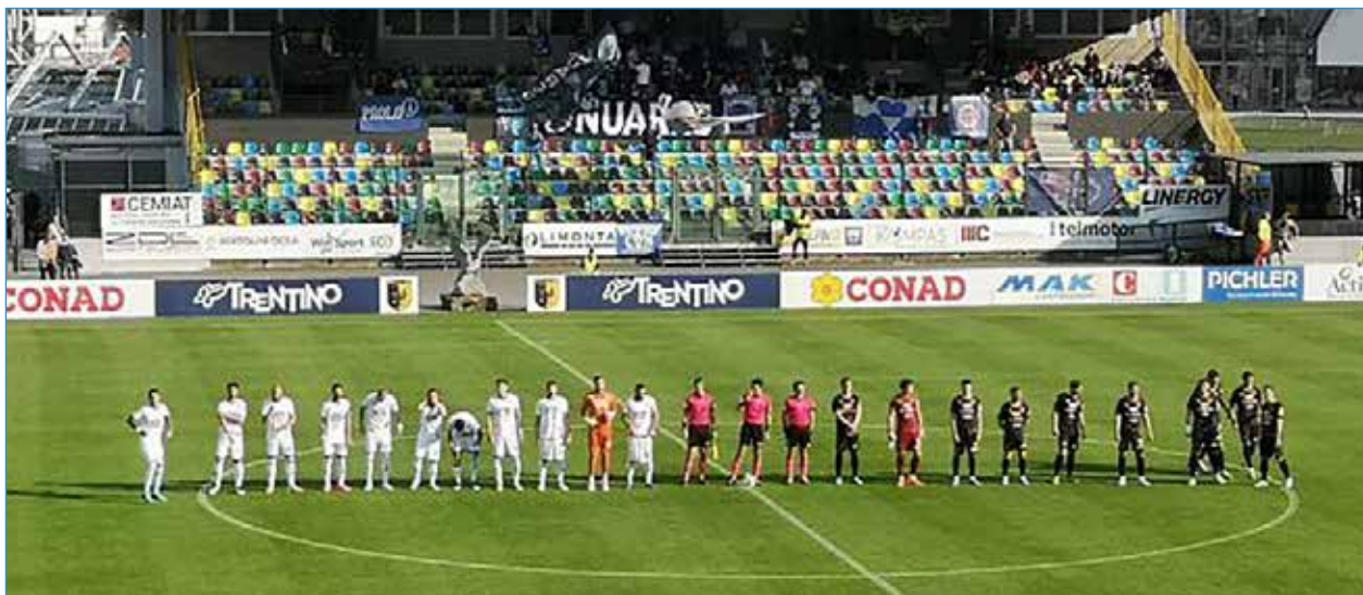
22 aprile 2023: le squadre a centrocampo prima del fischio d'inizio

Carissimo Diretto', giunto a scrivere del Trento di Tedino, la memoria non mi va così lontano. Desidero tornare allo scorso 22 aprile quando, nello Stadio Briamasco pavese a festa, facemmo da sparring partner ai gialloblù i quali, coi tre punti, si conquistarono una sudatissima salvezza evitando i Play Out. Noi eravamo praticamente già ai Play Off e... diciamo che non lottammo col coltello tra i denti. Al termine, dopo un po' di spavento portato dal risultato che la Pergolettese stava ottenendo contro la Triestina (ribaltato allo scadere), ci rassegnammo presto a ciò che era avvenuto, andando col pensiero alla prima (poi unica) contesa di Play Off che ci eravamo conquistati col decimo posto nella Regular Season, contro la Virtus Verona. Eravamo però consci di una cosa: