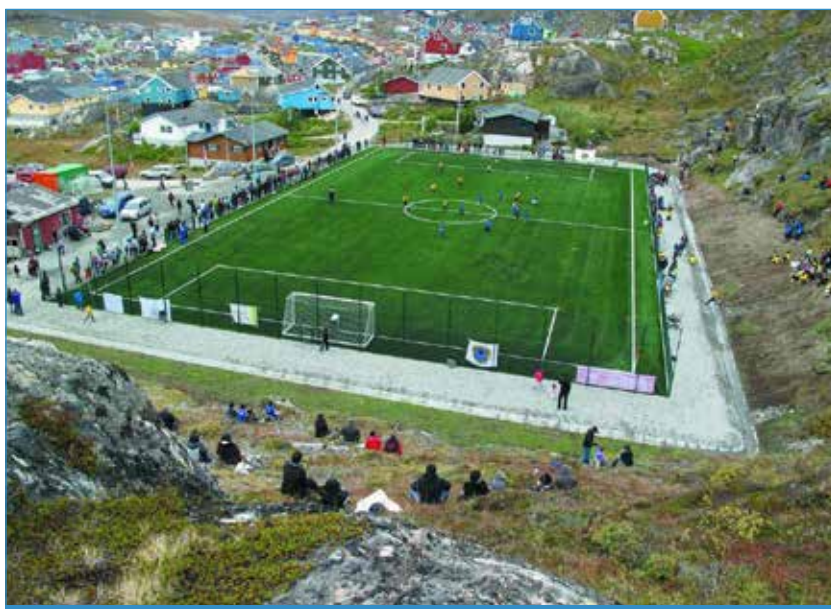
Il Nuuk Stadium

E chi ha mai sentito parlare della CONIFA? No, non stiamo parlando di sempreverdi ma della Confederazione delle Associazioni Calcistiche Indipendenti, è un organismo calcistico fondato nel 2013 e che rappresenta territori, etnie, regioni e minoranze senza un effettivo riconoscimento internazionale. Conifa conta quasi 60 federazioni membre suddivise in 5 aree continentali: Europa, Africa, America, Asia e Oceania. A cadenze regolari organizza sia la Coppa del Mondo, sia i singoli tornei continentali. Per dare un'idea delle squadre andiamo dall'Abcasia (Georgia / Russia) all'Artsakh (Repubblica del Nagorno Karabakh / Azerbaijan) fino alla Ciamuria (Albania / Grecia) e alla Cornovaglia (Inghilterra) per arrivare all'Isola d'Elba in Italia.